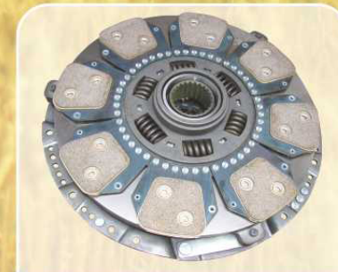
Сухая однодисковая муфта сцепления LuK (Германия)