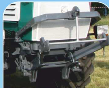
Переднее навесное устройство (опция)