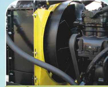
Система охлаждения двигателя повышенной эффективности