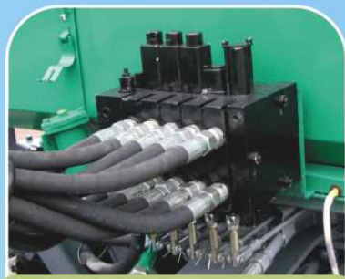
Пятисекционный пропорциональный распределитель гидросистемы навесного устройства (Италия) ②