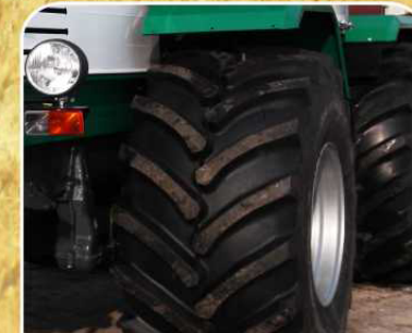
Шины с улучшенными тягово-сцепными характеристиками 28LR26 (опция)