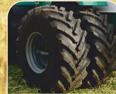
Система сдвигания колес 23,1R26 (опция)