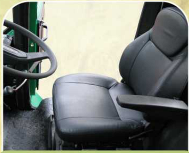
Комфортабельное сиденье на пневмоподвеске ①,②