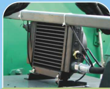
Теплообменник системы охлаждения масла гидросистемы навесного устройства ②