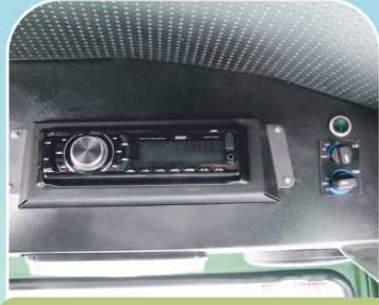
Аудиосистема и блок управления кондиционером