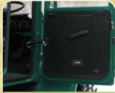
Двери с электростеклоподъемниками