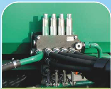
Четырехсекционный распределитель гидросистемы навесного устройства (Болгария) ①