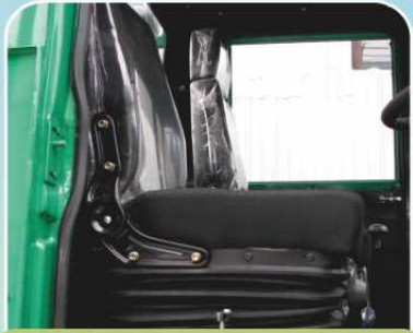
Сиденье водителя, регулируемое по 5-ти параметрам