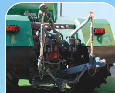
Крюковое заднее навесное устройство ①,②