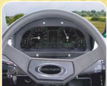
Многофункциональная комбинация приборов (опция)