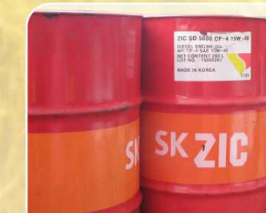
Высококачественное масло ZIC 15W40, 80W90 (Корея)

① для тракторов ХТА-250-10 ② для тракторов ХТА-250-20