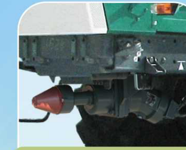
Вал отбора мощности передний (опция)