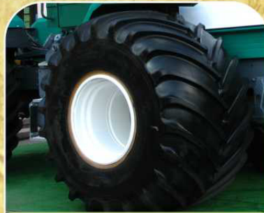
Шины сверхнизкого давления 66x43,00 R25 (опция)