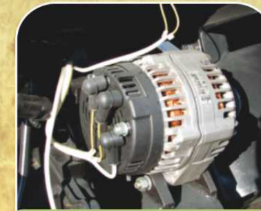
Генератор мощностью 2,8кВт ①,②