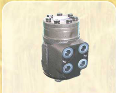
Насос-дозатор рулевого управления НКУQ 200/500/4