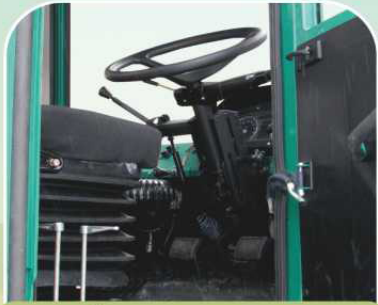
Рулевая колонка, регулируемая по углу наклона и высоте