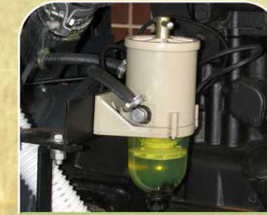
Фильтр – влагоотделитель топливной системы с функцией подогрева ①,②