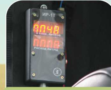
Расходомер топлива (опция)