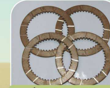
Фрикционные диски гидropоджимных муфт КПП (Австрия)