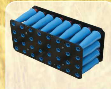
Мультициклон системы очистки воздуха двигателя