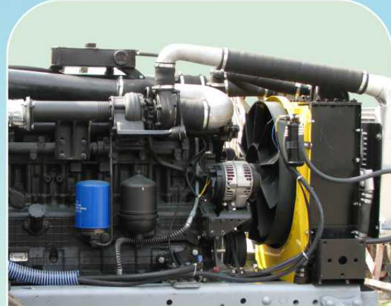
Двигатель Д-262.2 S2 производства ОАО «Минский Моторный Завод» (Беларусь) ①,②