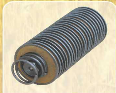
Секционный фильтр масла гидросистемы навесного устройства, рулевого управления, КПП (опция)