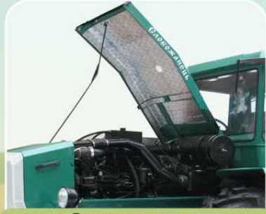
Откидной капот, шумоизоляция двигателя и кабины