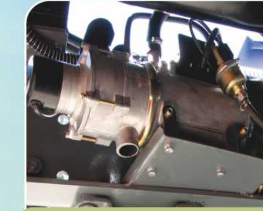
Предпусковой автономный подогреватель (опция)