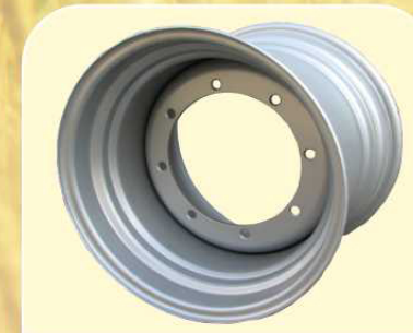
Колеса DW20 (Польша)